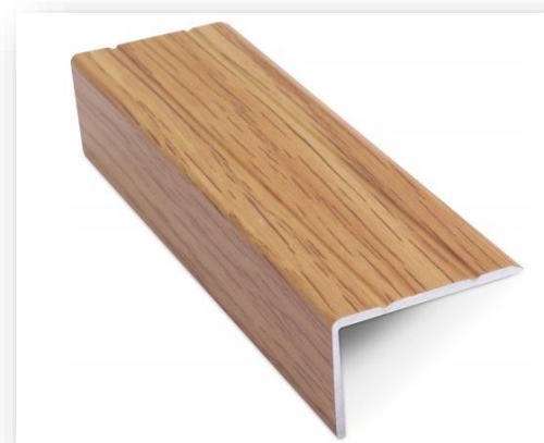
NAS207.40 - Oak

Perfiles de PVC • Pirlanes • Juntas de Expansión • Transiciones • Sellos • Protección de Esquinas • Perfiles de Metal • Cenefas • Herramientas